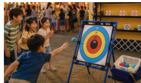
ターゲットダーツ